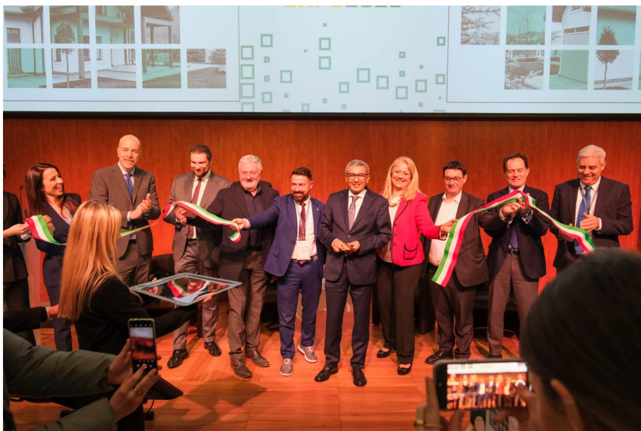
Taglio del nastro durante l'inaugurazione

Al via la prima edizione di Caseltaly Expo 2025, taglio del nastro per la fiera dedicata all'involucro edilizio Febbraio 13, 2025