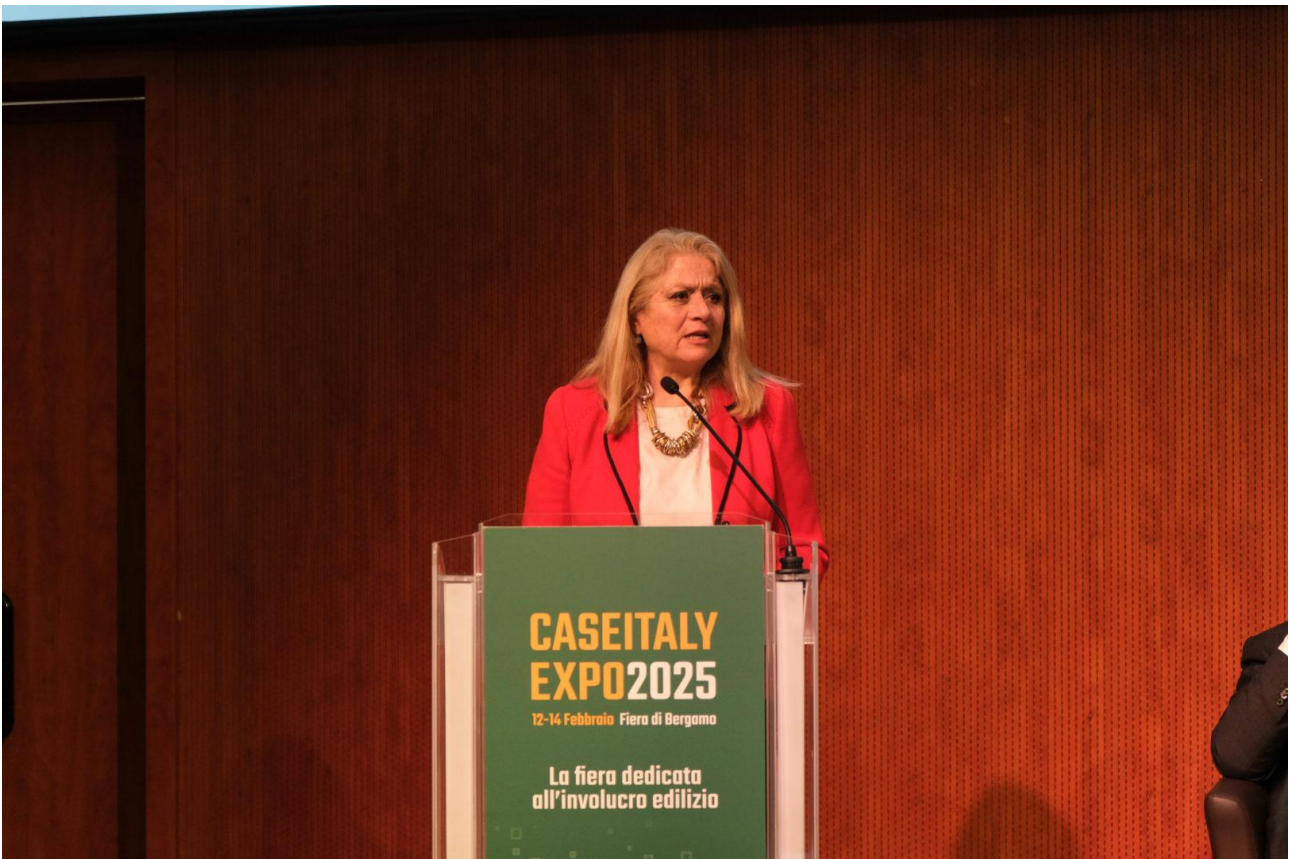
Carla Tomasi, Presidente FINCO

A prendere la parola anche Carla Tomasi, Presidente Finco che ha commentato: «Questo evento non solo rafforza le nostre imprese nel mercato globale, ma vuole sottolineare anche l'importanza strategica del comparto per la nostra economia, spesso sottovalutata ed alla quale non arride il "cono di luce" del Made in Italy. A Caseltaly Expo 2025 sono presenti Stand-Paese istituzionali come quello del Marocco, un settore con un alto potenziale di crescita dell'export. Basti pensare che in soli cinque anni, dal 2019 al 2023, il valore delle esportazioni in euro è salito da 2.708.326.685 a 3.475.675.223, con una crescita del 28%. Per l'anno 2024 – i cui dati saranno a breve disponibili grazie alla proficua collaborazione tra Finco e Istat – si stima che la crescita sarà ancora più sostenuta, sempre con saldo estremamente attivo. Le 17.000 imprese aderenti alle 40 associazioni federate a FINCO, la Federazione Industrie Prodotti Impianti Servizi e Opere Specialistiche per le Costruzioni, hanno infatti ancora notevoli margini di incremento dell'export. Ciò è vero soprattutto per quanto riguarda il mercato africano, con le connesse esigenze in termini di abitazioni e di logistica».