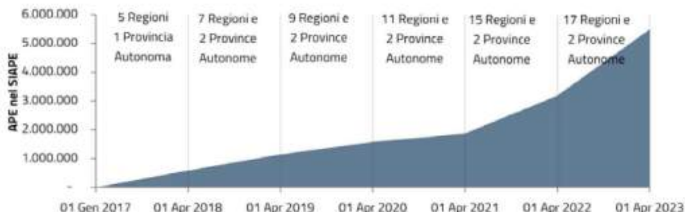
FIGURA 1 - Variazione degli APE contenuti nel SIAPE dal 01/01/2017 al 01/04/2023

Suddividendo le informazioni tra settore Residenziale e Non Residenziale, si nota una decrescita dell'EP g e dell'EP g,non tra il 2018 e il 2022, anche se, tale andamento, non è sempre continuo nel tempo per gli immobili residenziali, dove si nota, invece, una leggera crescita dei valori medi nel 2021. L'EP g,non invece, è caratterizzato da un andamento mediamente costante, con variazioni estremamente ridotte in termini assoluti. A livello generale, è possibile fare alcune valutazioni di carattere generale, valide anche per le analisi riportate successivamente nel presente capitolo: