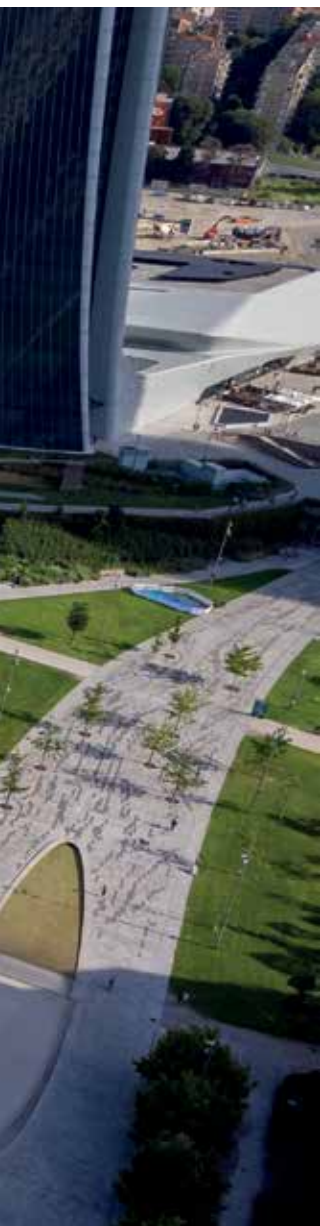
Veduta aerea delle Residenze Libeskind II da Piazza Giulio Cesare