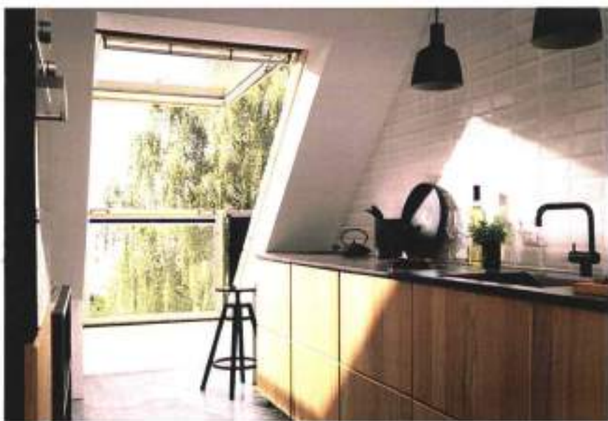
GDL Cabrio di Velux ( www.velux.it ) permette di avere un "balcone" in mansarda. È composta da una finestra superiore con apertura a vasistas (GPL), e da un elemento apribile a vasistas verso l'esterno, con ringhiera che si snoda automaticamente. In pino con trattamento di finitura in vernice acrilica a base d'acqua, nella misura L 94 x H 252 cm costa 2.257 euro + Iva e posa.

La più comune è quella a battente , con una o più ante incernierate al telaio sul lato verticale, con apertura verso l'interno. La finestra si apre completamente. Se il movimento è a ribalta o vasistas , l'anta si apre in modo obliquo verso l'interno, mentre sotto rimane chiusa e incernierata, e l'apertura ha raggio di inclinazione variabile. Il vantaggio è che è possibile aerare il locale senza necessità di aprire totalmente l'infisso. Molte finestre e portefinestre hanno, di serie, un doppio sistema di apertura: a battente e a vasistas. La finestra a bilico , con l'anta che ruota verso l'esterno sui perni posti ai lati del telaio, al centro o verso il basso, è invece il modello più utilizzato per tetti e mansarde, perché favorisce l'effetto camino, cioè fa uscire aria calda ed entrare quella fresca, per un perfetto ricambio. Può essere comandata a distanza.